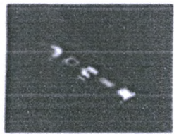
Standby and Sleep Mode ประหยัดพลังงาน