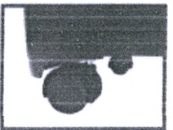
Caster Wheel มีล้อเลื่อน เคลื่อนที่สะดวก