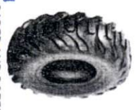
LOADER AND DOZER